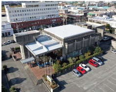
アルラ 【(協)浜松卸商センター】