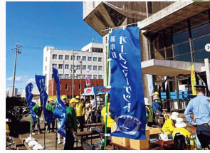
卸本町オープンマーケット