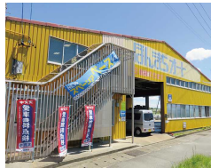
ほんまちオート 【自動車整備事業部】