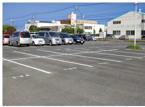
アルラ北側駐車場