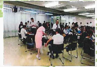
インフルエンザ予防接種